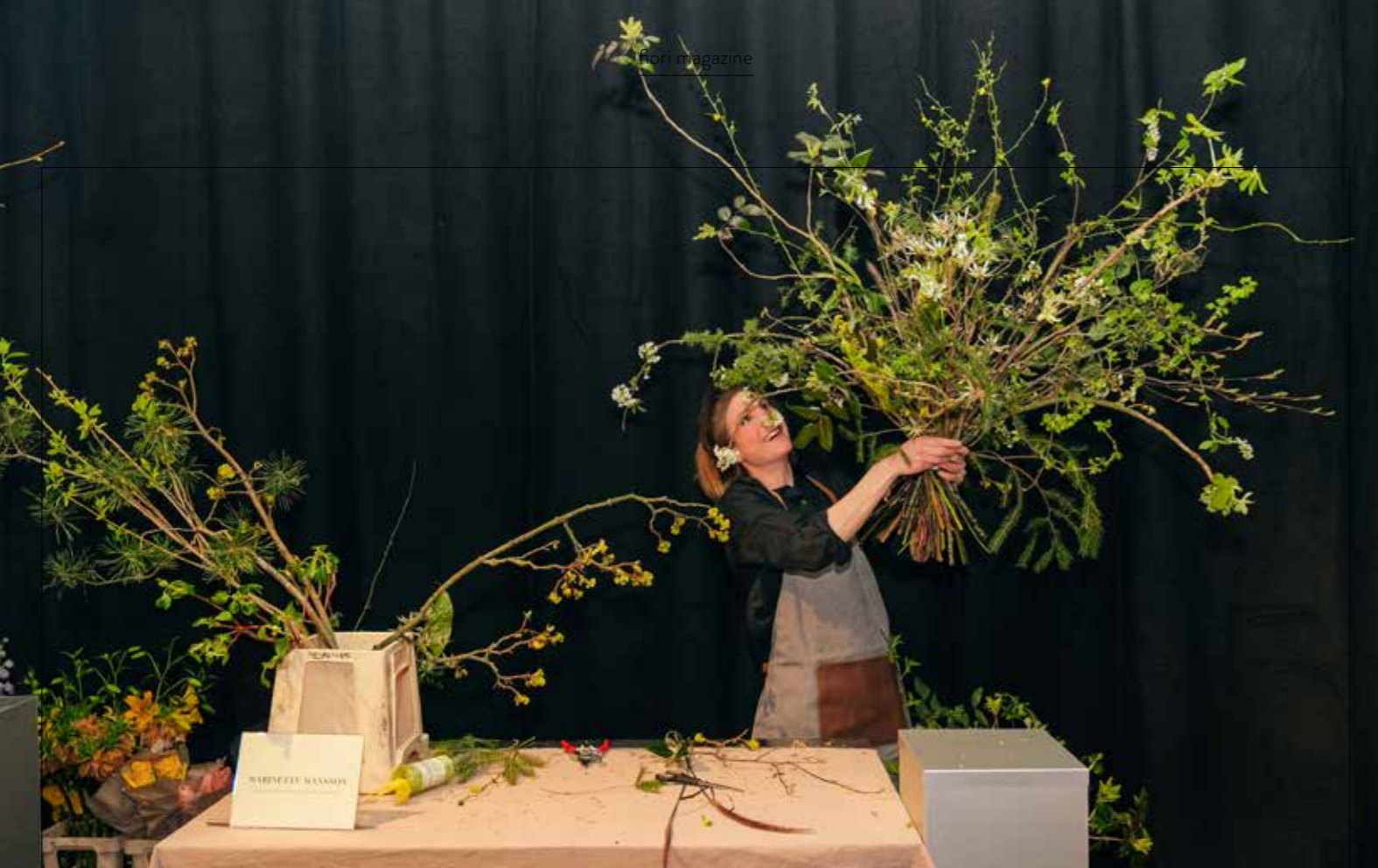
Du utvecklas så mycket när du går utanför din komfort zone och vardagsbinderierna.