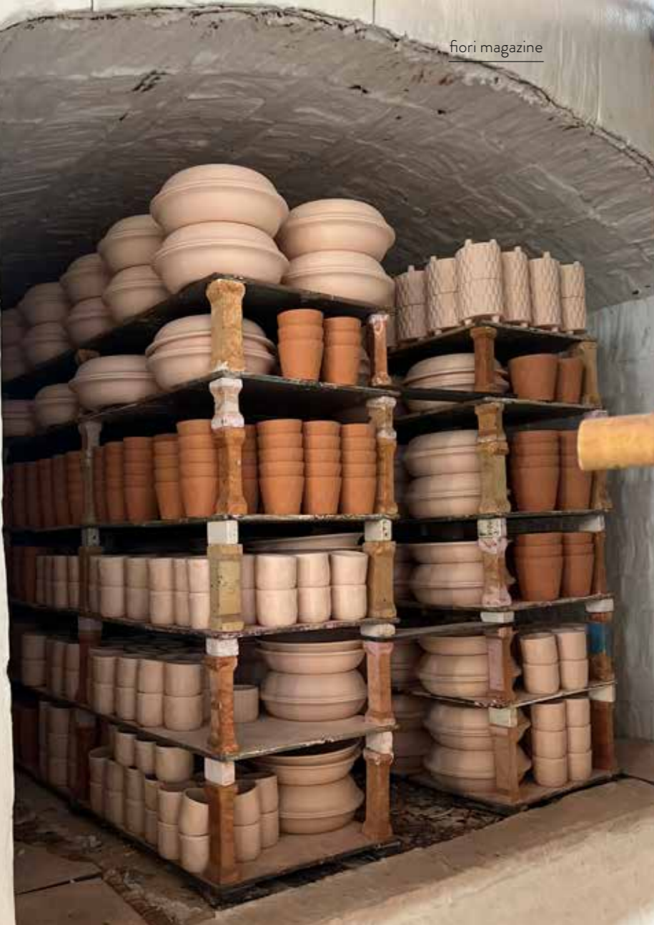
Mängder av handgjorda krukor, likadana men ändå unika.