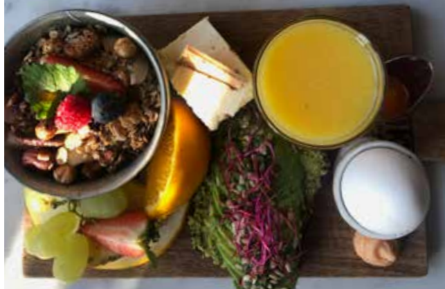
Inspiration finns överallt, från fat till bord.