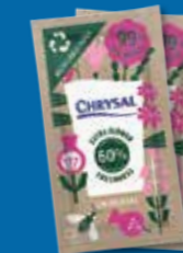
99% Biobaserad snittblomsternäring

Mer information hittar du på www.chrysal.se