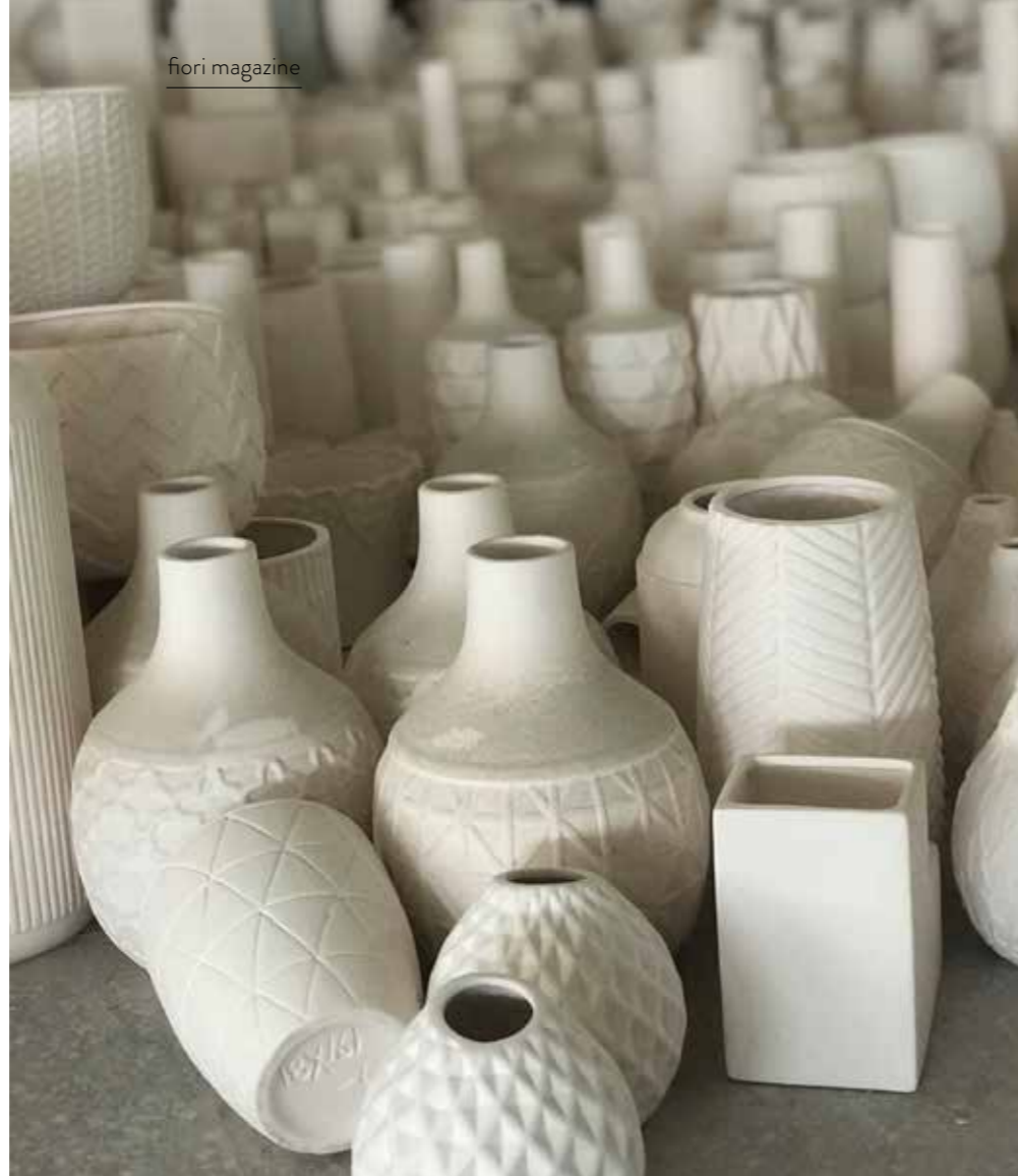
Varje krukorna blir unik.

– Ibland bättrar de på skarvar genom att stryka på ett tippex i samma färg och det är ju inte okej, krukorna ska inte vara ful. Ojämnheter är tecken på hantverket, varje krukorna doppas för hand i färgbadd innan den bränns i ugnen och det kan bli ojämnheter