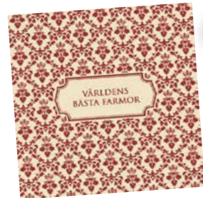
Kort, Sköna ting