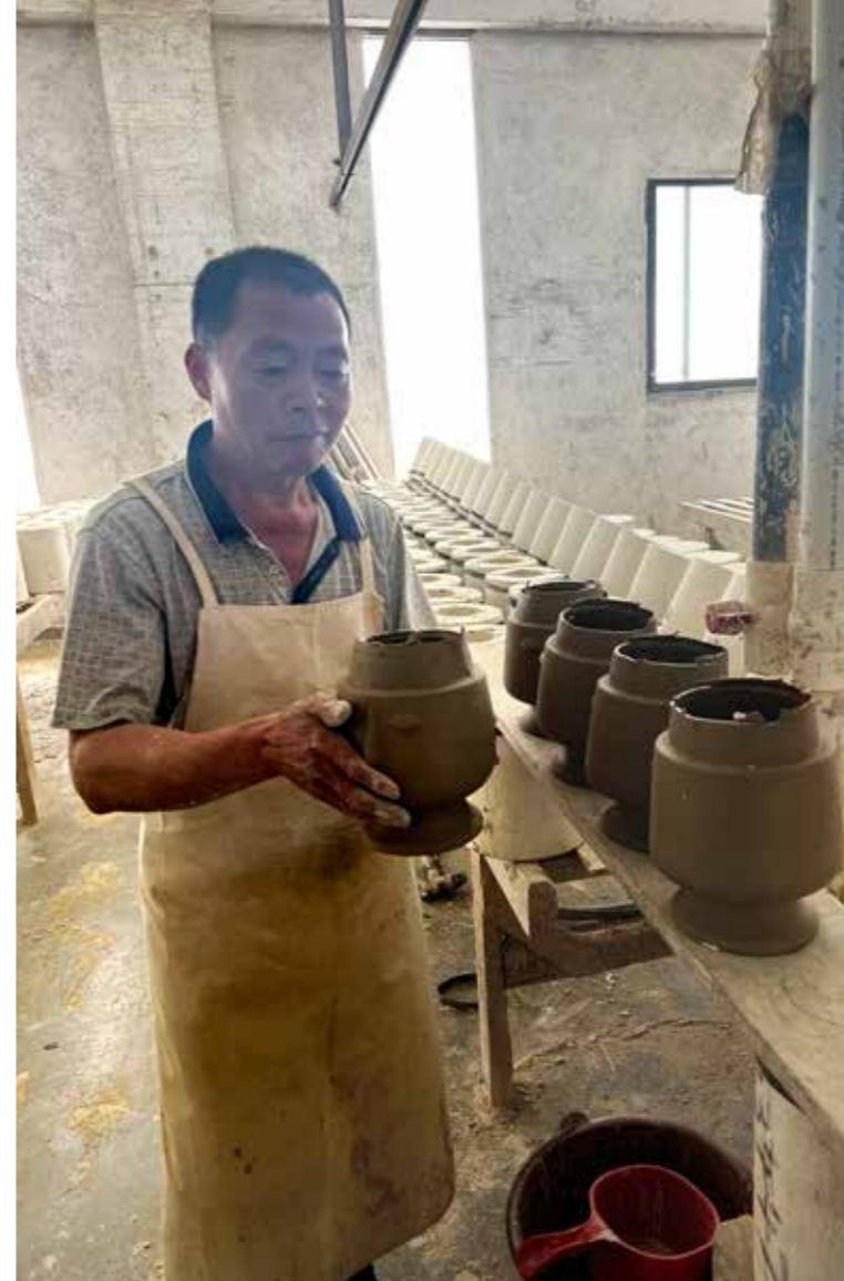
Fabriksägare och arbetare är gärna med på bild.