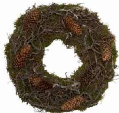
Krans, VK Vividi