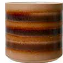
Kruka, Wikholm Form