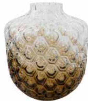
Vas, House Doctor