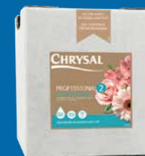
Chrysal Professional 2 rent vatten och hållbarhet