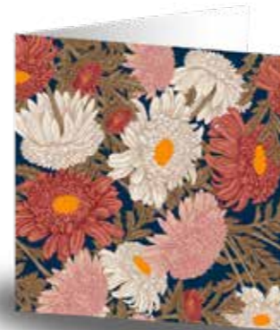
Kort, Jojo Cards