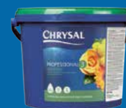
Chrysal Professional 3 För optimala arrangemang

Låt dina kunder njuta av dina blommor så länge som möjligt! Med Chrysal ger du dina blommor den bästa vården i varje fas.